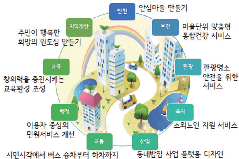
[그림 6-1] 도시행정 서비스디자인 적용 분야